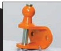
Kole s čepem 7004614