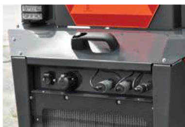
Snadné ovládání zadní hydraulických vývodů. Jako možnost - vývod 7-p přívěsu a 3-p kontrolní výstup pro ovládání elektrického ventilu.