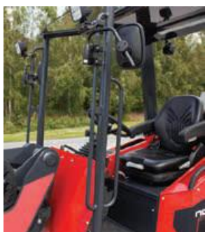
Rukojeť pro bezpečný a snadný přístup k sedadlu řidiče. Úložné boxy na obou stranách pro nářadí, telefon a příslušenství. 12 V a USB zásuvky.