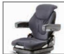
Komfortní sedačka 7006828