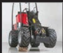
Zámek natáčení 7004620