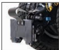
Hydraulický uzávěr 7004570