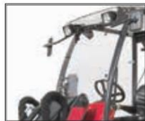
Přední okno 7004587