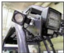
LED pracovní světla 7006039