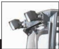
Zadní prac. světla 7004585