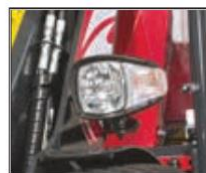
Silniční přísluš. 7004579