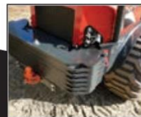
System dotížení 7008284 7008285