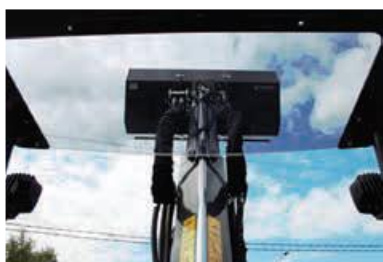
Vynikající výhled ve všech polohách ramene.