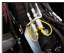
Extra Hydraulický výstup 7004272