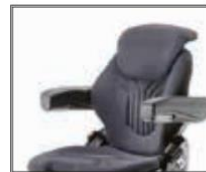
Elektrické vyhřívání 7006829