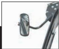
Spětná zrcátka 7004583