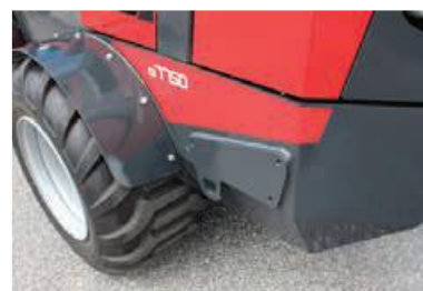
Deska se smyčkou pro bezpečné uchycení nakladače při transportu. 3xM10 na desce pro upevnění příslušenství.