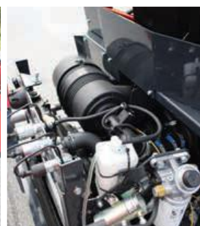
Dobrý přístup při servisu a každodenní údržbě.