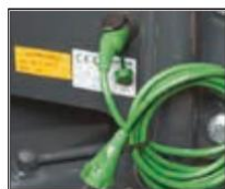
Předehřev motoru 7004575