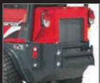
Držák závaží 7004610